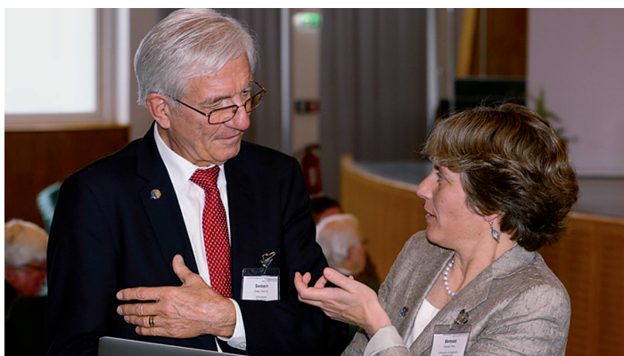
Carolyn R. Bertozzi im Gespräch mit Dieter Seebach.