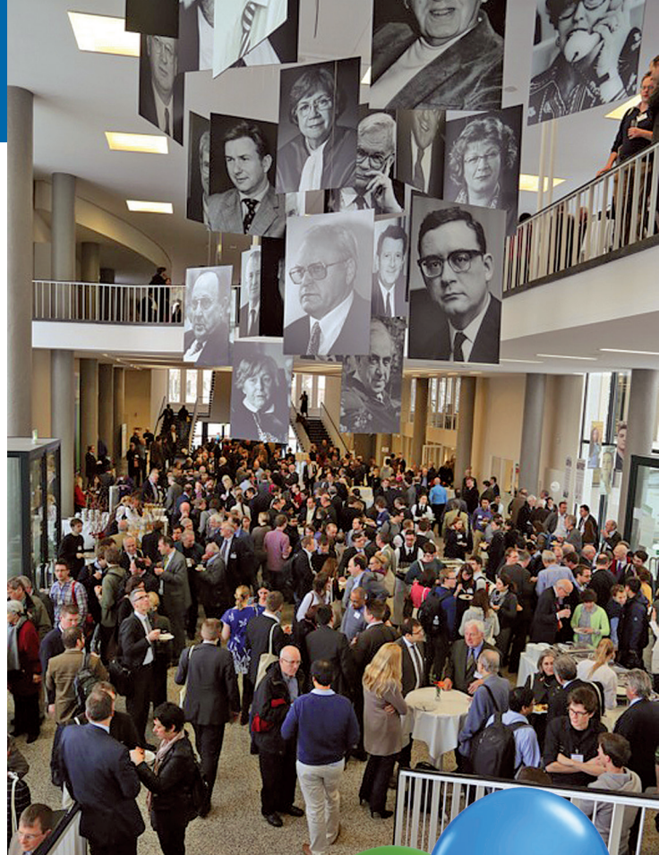
Gefülltes Foyer des Henry-Ford-Baus an der Freien Universität Berlin.