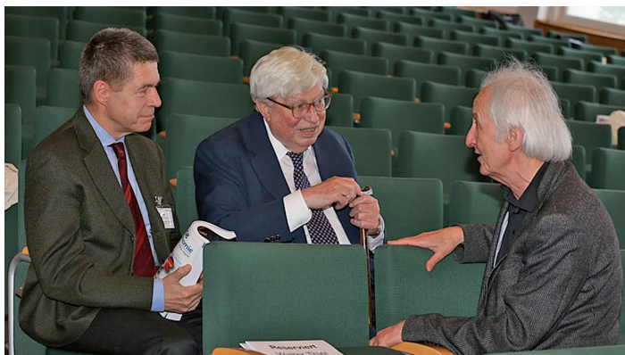
Joachim Sauer, Gerhard Ertl und Helmut Schwarz während einer Vortragspause.